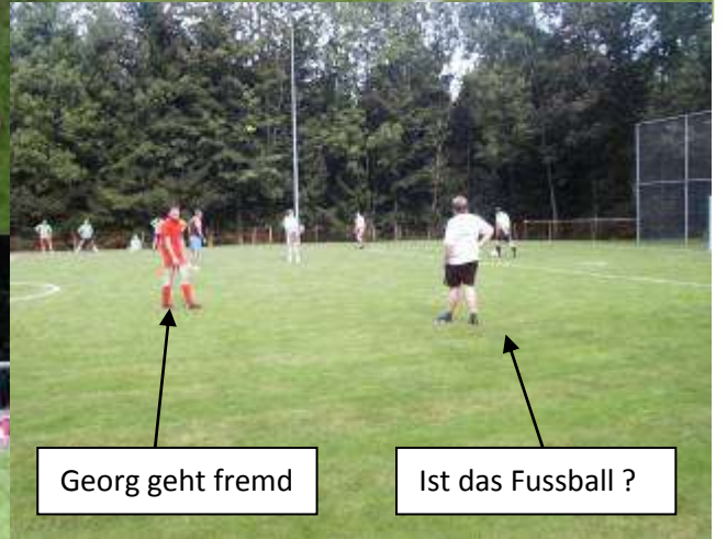
Georg geht fremd