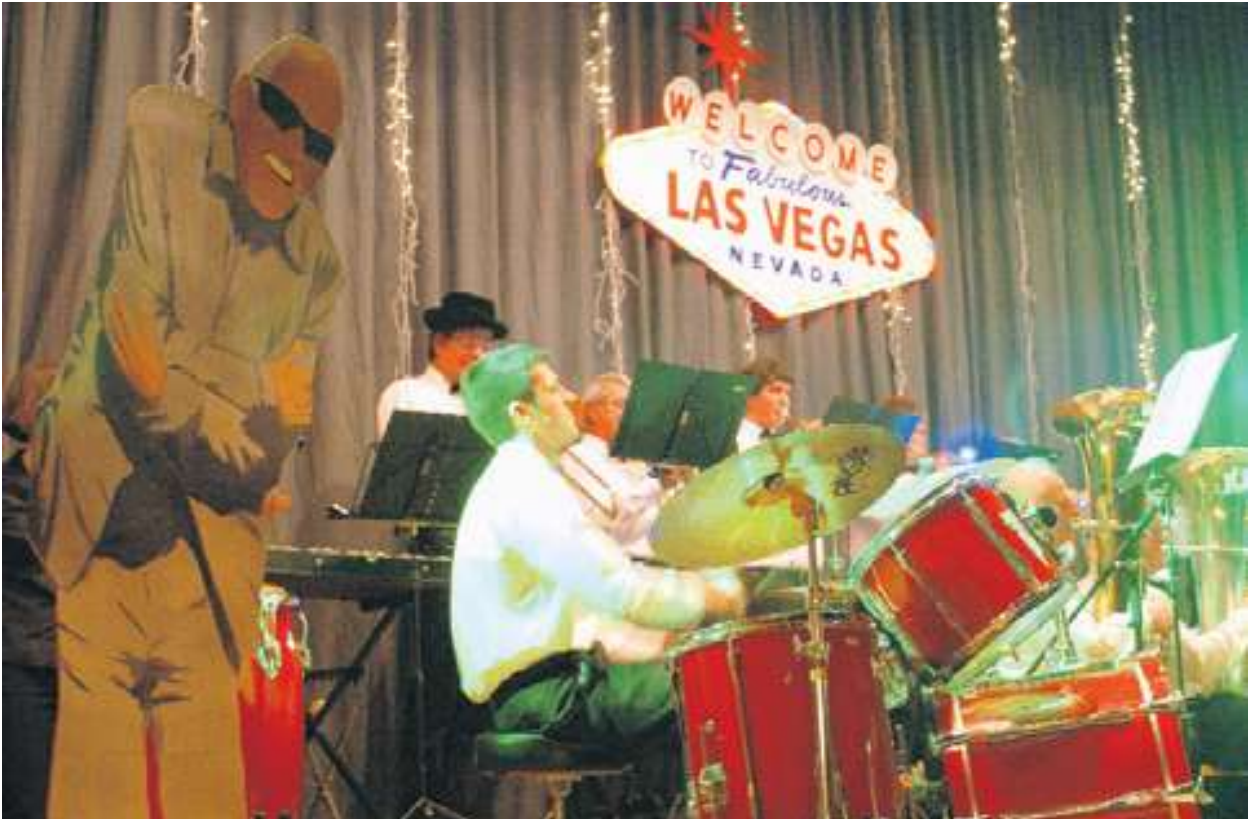
Ray Charles liess grüssen: Im «Las-Vegas-Teil» hatte man sich einiges einfallen lassen seitens des Musikvereins.