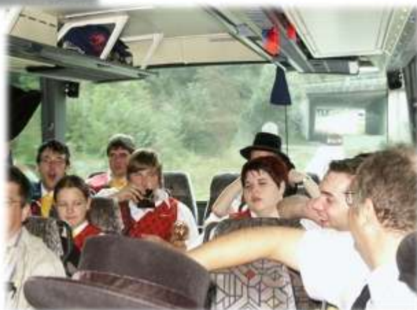
Die Heimfahrt war sehr gemütlich