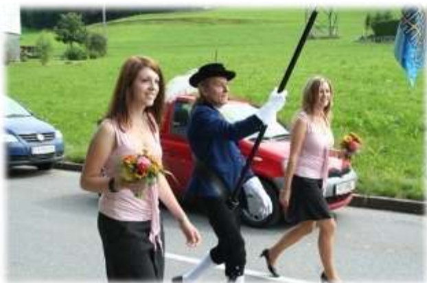
Voller Stolz marschiert unser Fähnerich mit den Festdamen

Eher weniger traditionell ist der Feuerwehrfest Besuch in Göfis. Trotzdem war es ein schöner Nachmittag geworden. Gemeinsam mit der Feuerwehr von Schellenberg fuhren wir mit dem Bus nach Göfis. Nach dem Einzug der Vereine gestalteten die teilnehmenden Musikvereine den Festnachmittag. Auch wir beteiligten uns mit einem ca. 1 stündigen Unterhaltungskonzert. Verpflegt wurden wir freundlicherweise von Herr Bitschnau aus Göfis, von dem wir uns am Abend musikalisch verabschiedeten. Pünktlich um 18.00 Uhr brachte uns der Bus incl. Feuerwehr vollzählig nach Schellenberg zurück.